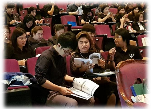
ตั้งใจเรียนกันทุกคนเลย Wow!!