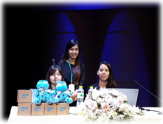
ทีม MM ก็มา