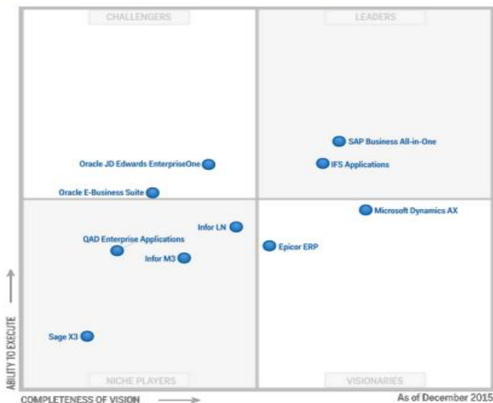
Figure 1. Magic Quadrant for Single-Instance ERP for Product-Centric Midmarket Companies