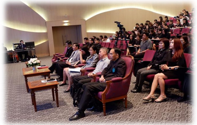
SU – ERP พร้อมแล้วจ้า