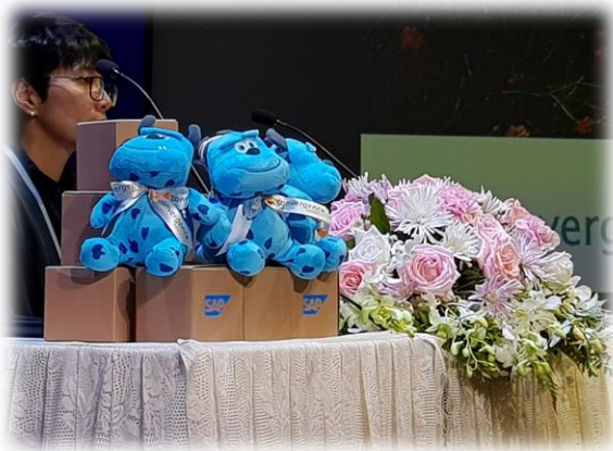
โมดูล FI กับตุ๊กตา Monster