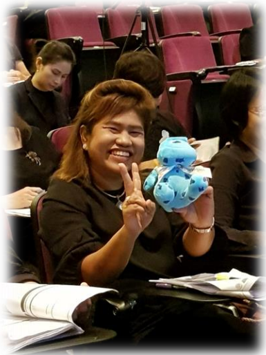
ตอบคำถามถูกต้องครบถ้วน ก็มีรางวัลให้ นะคะ