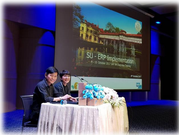
ยกมือตอบคำถามกันเยอะ ๆ นะจ๊ะ