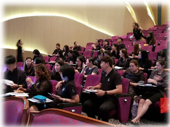
พร้อมลุยแล้วจ้า