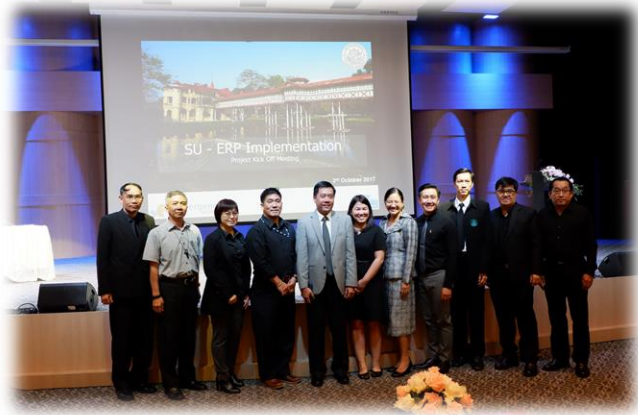
งาน Kick off Meeting