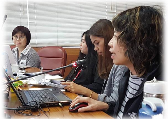
ถามมาตอบไป ได้ความรู้